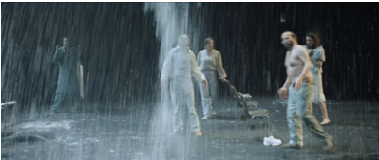
Still uit de film Oom Wanja

Noot: De rechten van de film werden door de NPO gekocht, waardoor de film nu te zien is via NPO.