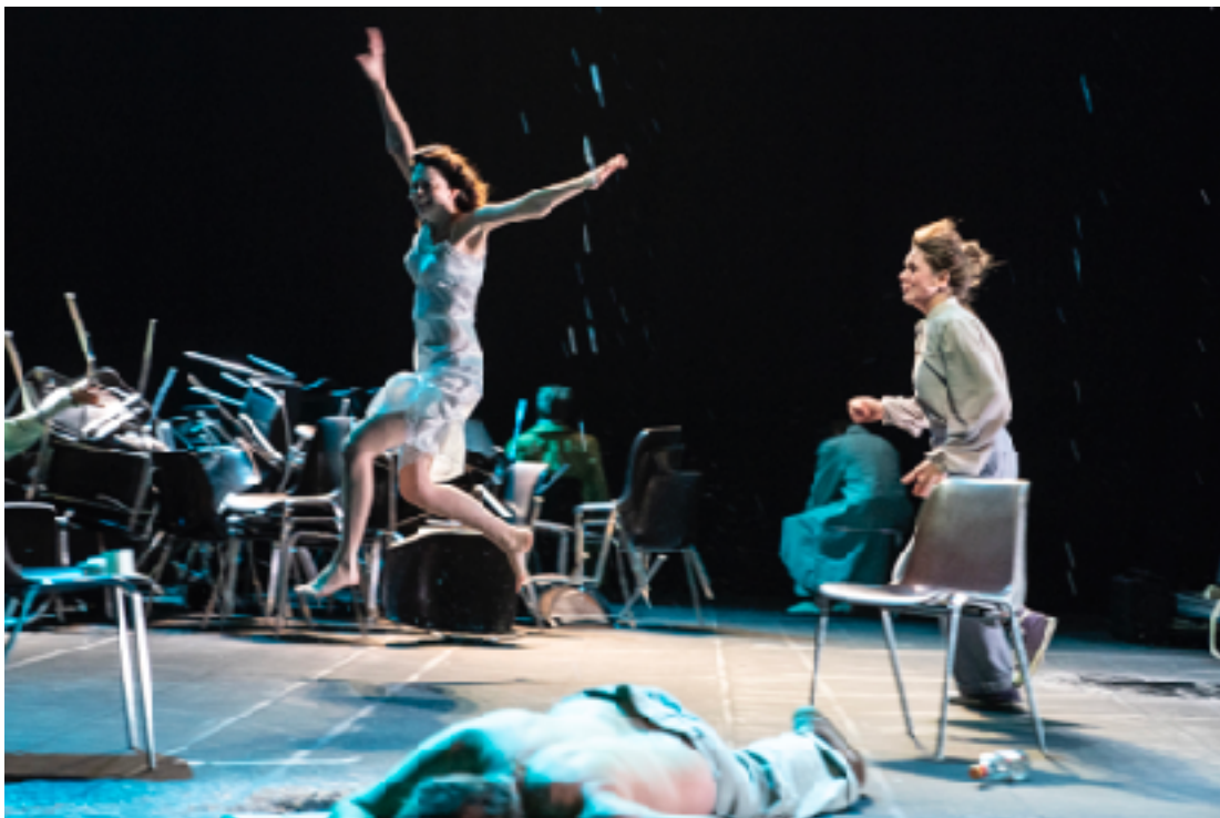
Uit de voorstelling Oom Wanja

"geslaagde, gedurfde, eigenzinnige en met regelmaat zelfs kolderieke over de top-aanpak van een van Tsjechovs voornaamste stukken"