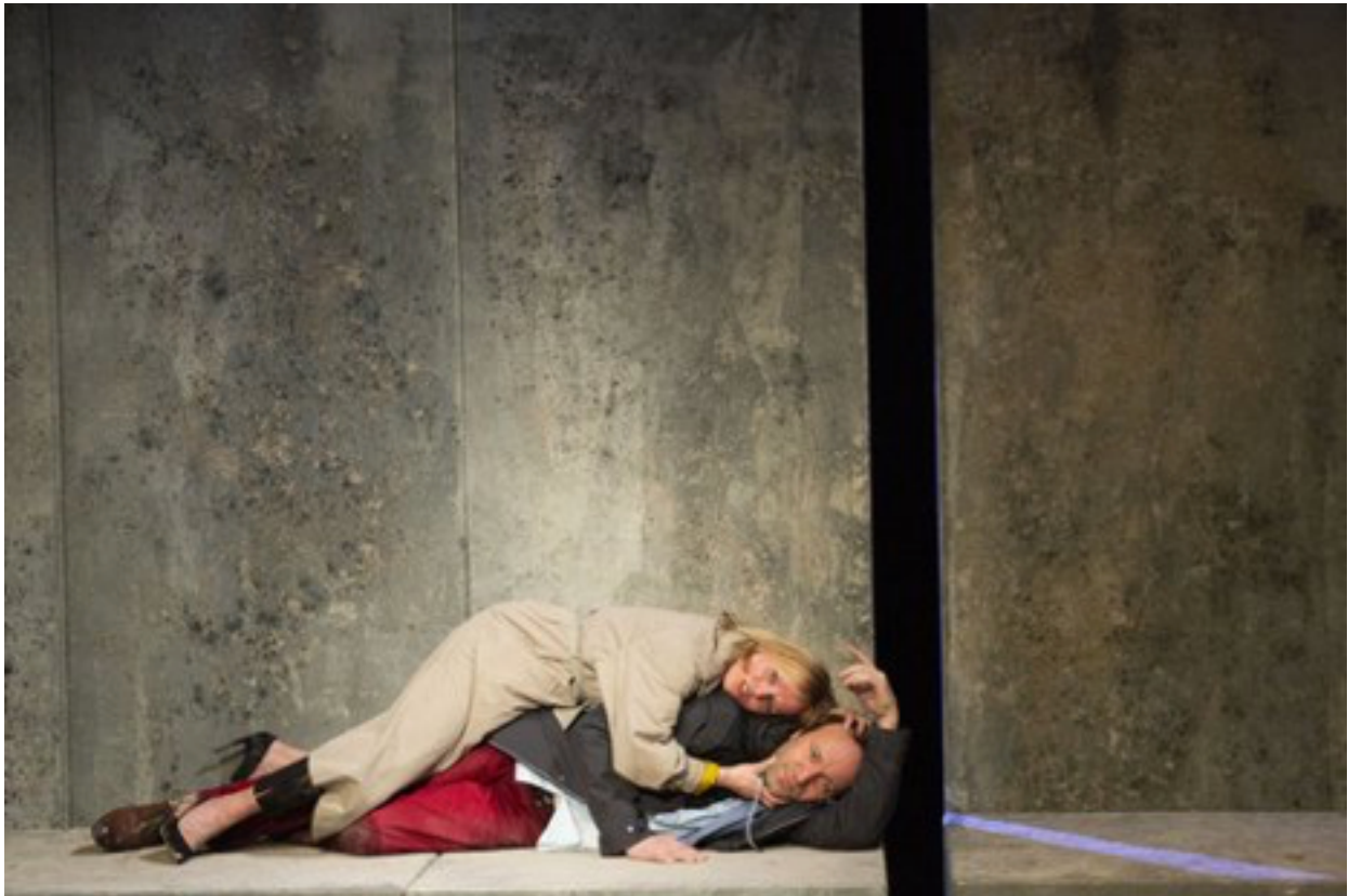
Uit de voorstelling Agatha (Matzer)

Van januari 2020 t/m maart 2020 repeteerde Liliane voor Agatha in Den Bosch. Op 6 maart ging de voorstelling in première en een paar dagen later waren alle theaters gesloten en moest de voorstelling worden bewaard om volgend seizoen terug te komen in de kleine zalen van de theaters.