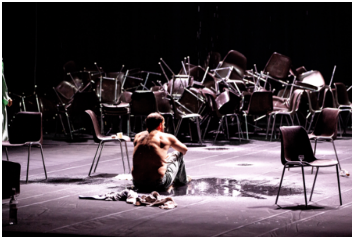
Uit de voorstelling Oom Wanja (NNT)