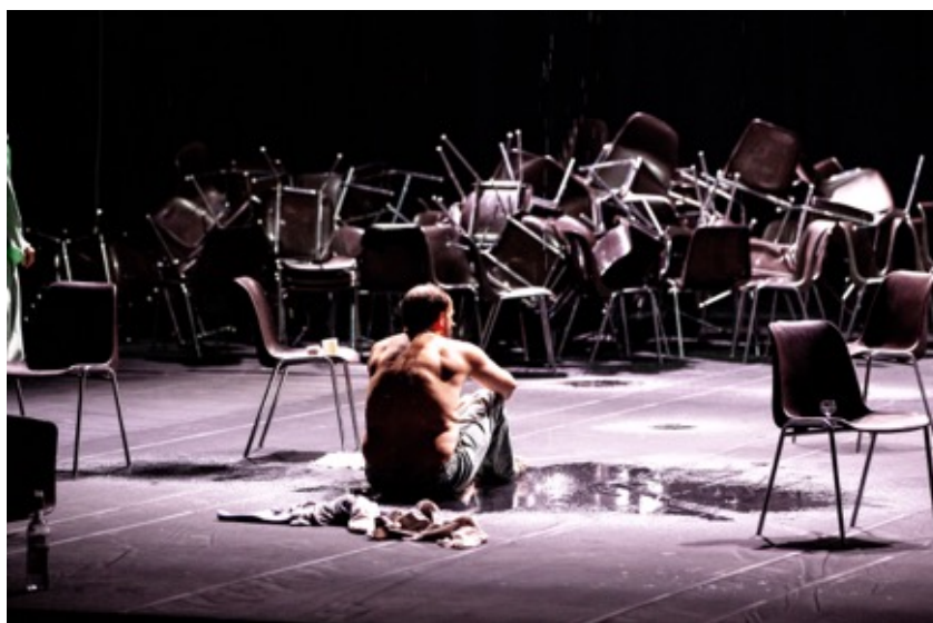
Uit de film Oom Wanja (NNT)

In het kader hiervan en als eerste stap op weg naar haar eigen 'nieuwe verhaal' is besloten om Firma Ducks vanaf 2022 te veranderen in &Brakema Producties (zie 1.4)