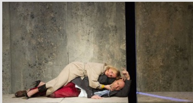
Uit de voorstelling Agatha (Matzer)